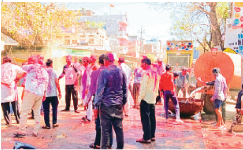
हरिभूमि न्यूज गुला