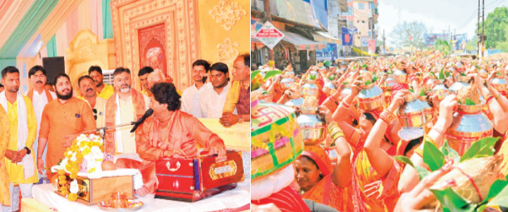
हरिभूमि न्यूज ललितपुर

स्थानीय श्रीतुवन मंदिर प्राणगण में आध्यात्मिक और सांस्कृतिक कार्यक्रमों की धूम रहने वाली है। मंदिर परिसर में सप्ताह ज्ञान यज्ञ के साथ-साथ सचलव्यवस्था पार्थिव शिवलिंग निर्माण का भव्य आयोजन किया जा रहा है, जो 8 मार्च 2026 से शुरू होकर 14 मार्च 2026 तक चलेगा। इस आयोजन के विशेष आकर्षण के रूप में 11 मार्च को सायं 6 बजे से एक विशाल कवि सम्मेलन का आयोजन किया जाएगा। इस संगीतमय श्रीमद्भागवत